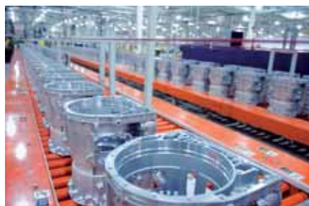
Mayor productividad con un coste total de propiedad (TCO) inferior, p. ej., en una fábrica de engranajes.

Todos los productos de Mitsubishi se desarrollan y diseñan con miras a lograr niveles elevadísimos de fiabilidad. Sin embargo, si se requiere mantenimiento, la productividad de los técnicos se ve mejorada de diversas maneras. La arquitectura de red abierta CC-Link e iQ Works permiten a un técnico de mantenimiento localizar los fallos de una red entera de controladores iQ desde un único lugar. Esto permite localizar y abordar con rapidez los problemas de transmisión a través de las líneas. Si es preciso abrir armarios, el personal de servicio llega ya preparado para ejecutar inmediatamente las medidas pertinentes.